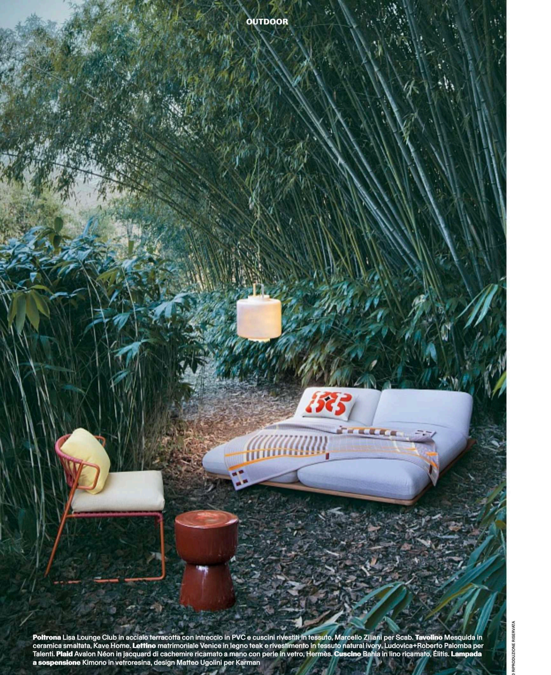
Poltrona Lisa Lounge Club in acciaio terracotta con intreccio in PVC e cuscini rivestiti in tessuto, Marcello Ziliani per Scab. Tavolino Mesquida in ceramica smaltata, Kave Home. Lettino matrimoniale Venice in legno teak e rivestimento in tessuto natural Ivory, Ludovica+Roberto Palomba per Talenti. Plaid Avalon Néon in jacquard di cachemire ricamato a mano con perle in vetro, Hermès. Cuscino Bahia in lino ricamato, Élitis. Lampada a sospensione Kimono in vetroresina, design Matteo Ugolini per Karman